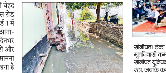
गन्नाौर। नाली के ऊपर रखे उभरे जाल, गली में जमा गंद पानी बीमारियों को दे रहा न्योता।