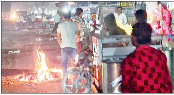
सोनीपत। बहालगढ़ में कूड़े में लगाई गई आग।

मिलकर सांस लेना मुश्किल बना रही है। बता दें कि नवंबर की शुरुआत से ही जिले में एक्यूआई लगातार 200 के ऊपर बना हुआ है। सोमवार को जहां यह 345 दर्ज किया गया था, वहीं मंगलवार को बढ़कर 381 तक पहुंच गया। बुधवार को उत्तर-पश्चिमी हवा चलने से उम्मीद जाता जा रही थी कि वायु गुणवत्ता में सुधार होगा, लेकिन हालात में कोई खास फर्क नहीं आया और एक्यूआई 372 तक दर्ज किया गया। विशेषज्ञों का कहना है कि धीमी हवाएं, प्रदूषण के स्रोतों पर नियंत्रण की कमी और