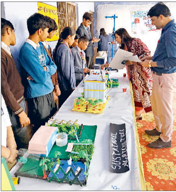
खरखोदा। बाल वैज्ञानिक प्रदर्शनी का अवलोकन करते अधिकारी।

खंड शिक्षा अधिकारी कार्यालय खरखोदा में खंड स्तरीय बाल वैज्ञानिक विज्ञान प्रदर्शनी का आयोजन किया गया। इस प्रदर्शनी में खंड के राजकीय एवं हरियाणा बोर्ड से संबद्ध प्राइवेट विद्यालयों के छात्रों से बारहवीं कक्षा में पढ़ने वाले छात्रों ने भाग लिया। इस बार की विज्ञान प्रदर्शनी का मुख्य विषय विकसित और आत्मनिर्भर भारत के लिए स्ट्रेम रहा। जिसमें भारत उप विषय- सतत कृषि, कचरा प्रबंधन और प्लास्टिक के विकल्प, हरित ऊर्जा, उभरती हुई तकनीकें, मनोरंजक गणितीय मॉडलिंग, स्वास्थ्य व स्वच्छता तथा जल संरक्षण व प्रबंधन रहे। इस प्रदर्शनी का आयोजन एससीईआरटी गुरुग्राम के द्वारा कराया जा रहा है, ताकि छात्रों में वैज्ञानिक दृष्टिकोण, तार्किक क्षमता, रचनात्मकता व तकनीकी ज्ञान का विकास हो। यही राष्ट्रीय शिक्षा नीति 2020 का मुख्य उद्देश्य भी है कि छात्रों में वैज्ञानिक दृष्टिकोण एवं रचनात्मकता का