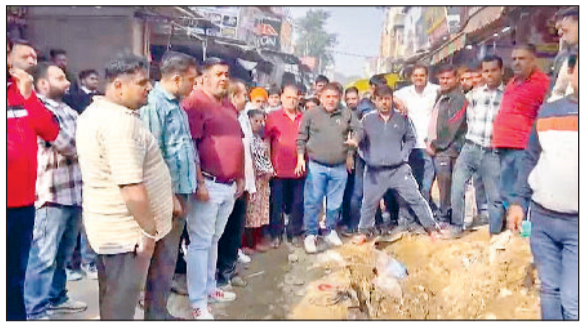
सोनीपत। कच्चे क्वार्टर बाजार में प्रदर्शन के दौरान रोष जताने हुए दुकानदार।

कच्चे क्वार्टर बाजार में बुधवार को दुकानदारों ने हंगामा कर दिया। सीवर लाइन दबाने के लिए खोदी गई सड़क के चलते पानी के कनेक्शन कटने से नाराज दुकानदारों ने सुबह के समय दुकानें बंद कर नगर निगम के खिलाफ रोष जताया। इस दौरान स्थानीय दुकानदारों ने बताया कि इलाके में पेयजल संकट बन गया है। कई दुकानों और घरों में पानी की नहीं है। इसके अलावा सड़क पर जो गड्ढा बना हुआ है, उसमें रोजाना कोई ना कोई गिर कर घायल हो रहा है। इस दौरान दुकानदारों ने रोड जाम की चेतावनी दी। इस मामले में नगर निगम अधिकारियों का कहना है कि जल्द ही पेयजल कनेक्शन जोड़ दिए जाएंगे और गड्ढा भी मिट्टी से भर दिया जाएगा।