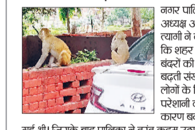
गई थी। जिसके बाद पालिका ने तुरंत कदम उठाने का निर्णय लिया। अभियान शुरू होने के बाद शहर के मुख्य बाजारों, स्कूलों और रिहायशी क्षेत्रों में सबसे पहले कार्रवाई की जाएगी। उन्होंने बताया कि नगर पालिका की प्रशिक्षित टीमों की सुरक्षा और शहर की स्वच्छता सुनिश्चित करना है।